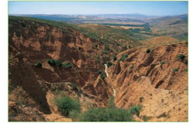
▶ Formas del relieve producidas por el agua.