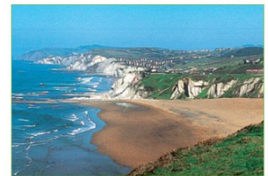
▶ Formas del relieve costero.