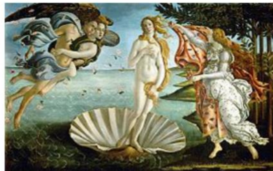
El nacimiento de Venus de Botticelli