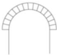
Arco de medio punto

Recuperó los elementos clásicos como el arco de medio punto, la bóveda de cañón y las columnas clásicas.