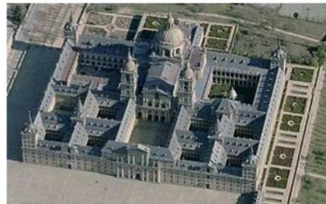
Monasterio de San Lorenzo de El Escorial

A finales del siglo XVI surge otro estilo propio del renacimiento español: el estilo herreriano, caracterizado