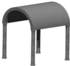
Bóveda de cañón