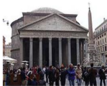
Frontón triangular del panteón de Roma

Los edificios eran más pequeños y más bajos que los góticos. Se decoraban de forma sencilla, pretendían dar una sensación de orden y armonía.