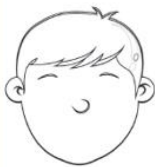
Mario is sad